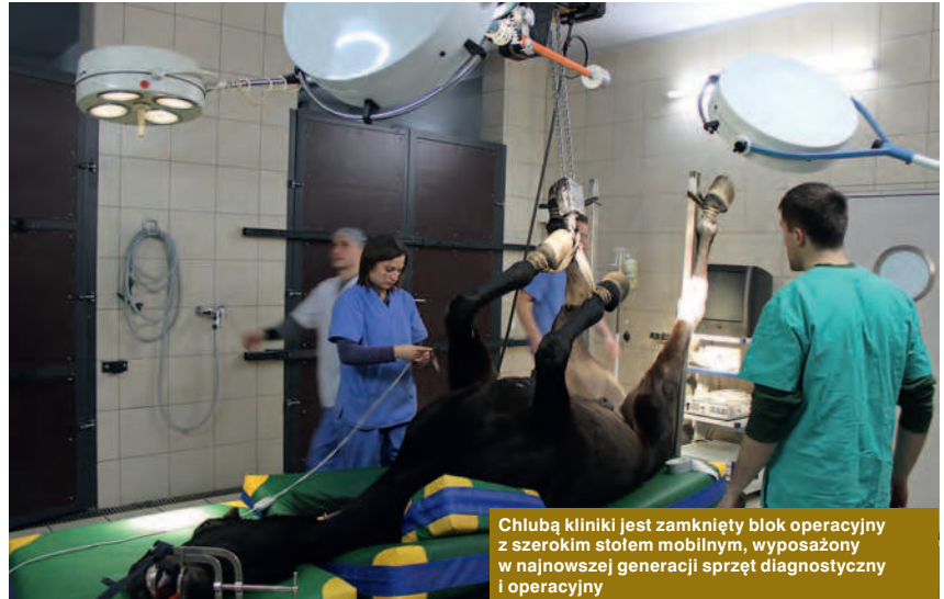
Chlubą kliniki jest zamknięty blok operacyjny z szerokim stołem mobilnym, wyposażony w najnowszej generacji sprzęt diagnostyczny i operacyjny