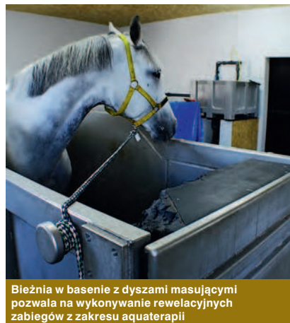
Bieżnia w basenie z dyszami masującymi pozwala na wykonywanie rewelacyjnych zabiegów z zakresu aquaterapii